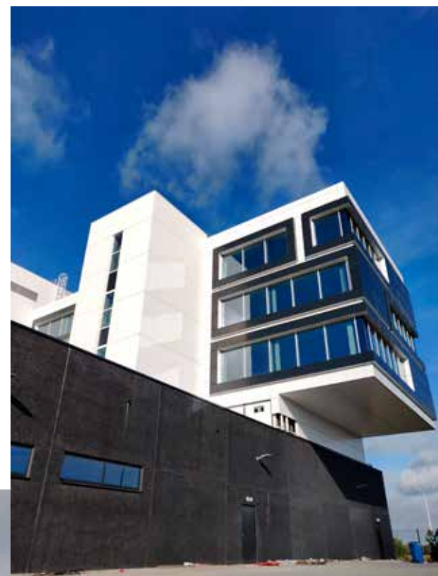
Vier kantoorverdiepingen 'zweven' boven de sokkel uit

Het kantorencomplex rust op een antracietkleurige betonnen sokkel, die met een hoogte van 6,3 meter oprijst uit het groen dat het gebouw omhult. Daarin zijn het magazijn, het archief en het lasatelier ondergebracht. Vier kantoorverdiepingen 'zweven' boven dit basisvolume uit. "De ramen en de uitkraging naar de noordoostzijde geven het gebouw een horizontale geleiding, ver-