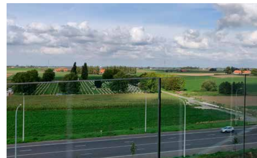
De Eerste Wereldoorlog is nooit veraf.

"Het witte beton legt de link met de vele witte graven van de Eerste Wereldoorlog, terwijl de strakheid van de metalen beplating een sterk gestructureerd bedrijf symboliseert"