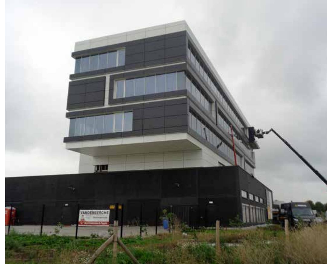
Het kantorencomplex rust op een antracietkleurige betonnen sokkel, die met een hoogte van 6,3 meter oprijst uit het groen dat het gebouw omhult.

vertelt Philippe Honoré, projectmanager van Wycor. "We werden geconfronteerd met uitvoeringsmethodes waar we zelf niet 100% achter stonden, maar waarop we toch moesten voortbouwen. Gelukkig konden we volop rekenen op de architect, die heel veel uren met ons heeft gespendeerd op de werf."