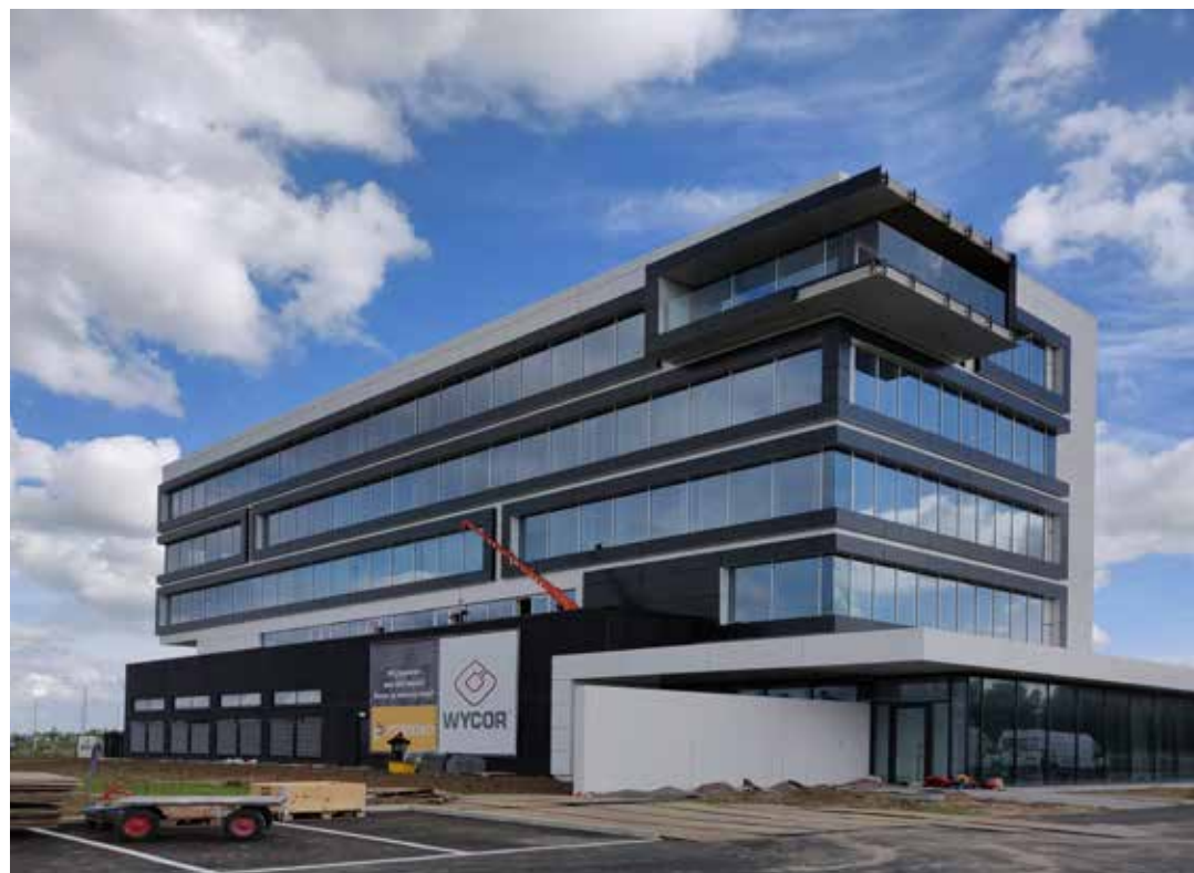
De raamomlijsting beoogt speelsheid en variatie in de gerichtheid van het gebouw. Ze springt lichtjes uit het gevelvlak en wordt op een aantal plaatsen 'willekeurig' onderbroken.